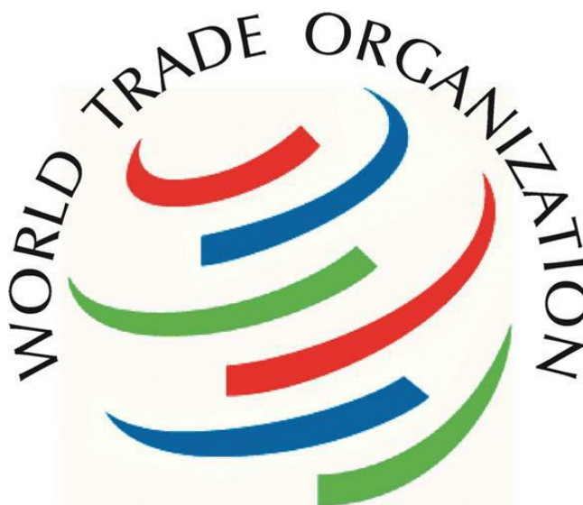
Slika 1. Logo Svjetske trgovinske organizacije (“Svjetska trgovinska organizacija“, 2012; „World Trade Organization“ [WTO], 2020)

Međunarodna trgovina počiva na osnovnim principima Svjetske trgovinske organizacije (WTO): principima nediskriminacije, slobodne trgovine, transparentnosti i podsticanja konkurencije (Slika 1). Ovi principi su korišćeni i prilikom potpisivanja velikog broja regionalnih trgovinskih sporazuma širom svijeta (slika 2, prilog 1).